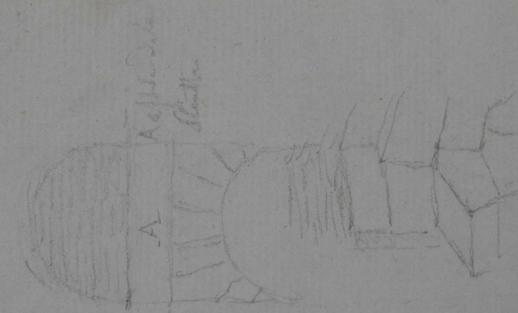
Fig. 1. Contour de la nef de la cathédrale

Monsieur Paris, Directeur par intérim de l'École française des Beaux-arts à Rome